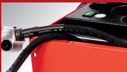
Fleksibilna creva za rad na nepristupačnim mestima