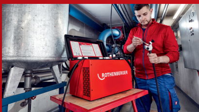
Upotreba paste za zaleđivanje garantuje pouzdan proces zaleđivanja