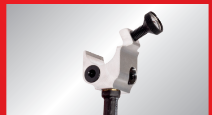
Kompaktna stezna glava i termometar