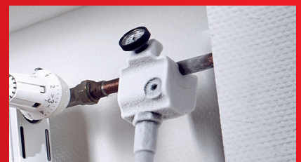
Lagan pristup kod rada blizu zida ili poda