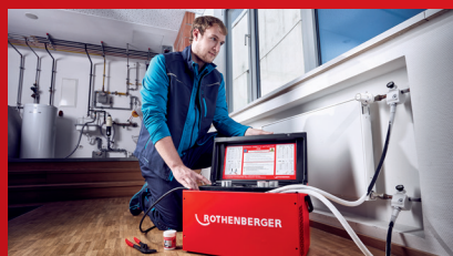
Proces zaleđivanja počinje automatski nakon postavljanja steznih glava